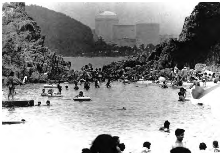
"A Beautiful Day at Crystal Beach"– a pre -3/11 photograph by Kenji Higuchi. The Mihama Nuclear Power Complex in the background discharges 70 tons of heated wastewater every second.

There are lessons to be learned here. History will make them known to us. The sooner we learn them, the better.